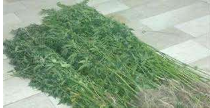
Hasadı yapılmış olan kendir bitkisi. Limanlama ve kurutulma işlemi yapıldıktan sonra, işliklere taşınacaktır.

M.Ö. 2 bin. Yıllarına tarihlenen bazı tabletlerden, Dokumacılıkta kullanılan kendir bitkisi, eski çağlarda sadece urgan yapımının yanında bazı kaba dokumalarda da kullanılmıştır.