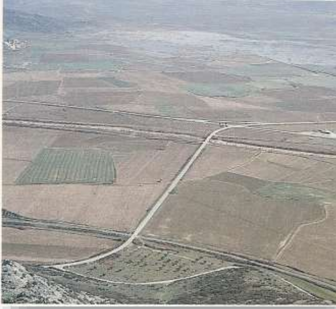
Keçi Kalesi'nden Belevi Gölü ve Tire yönüne bir bakış. Boğaziçi olarak adlandırılan bu bereketli topraklarda bir zamanlar kenevir ekimi oldukça yaygındı.

Tire'nin bilinen tarihi oldukça eskiye dayanmaktadır. Kent en parlak dönemine Aydınoğulları Beyliği ve Osmanlı yönetimi sırasında kavuşmuştur.