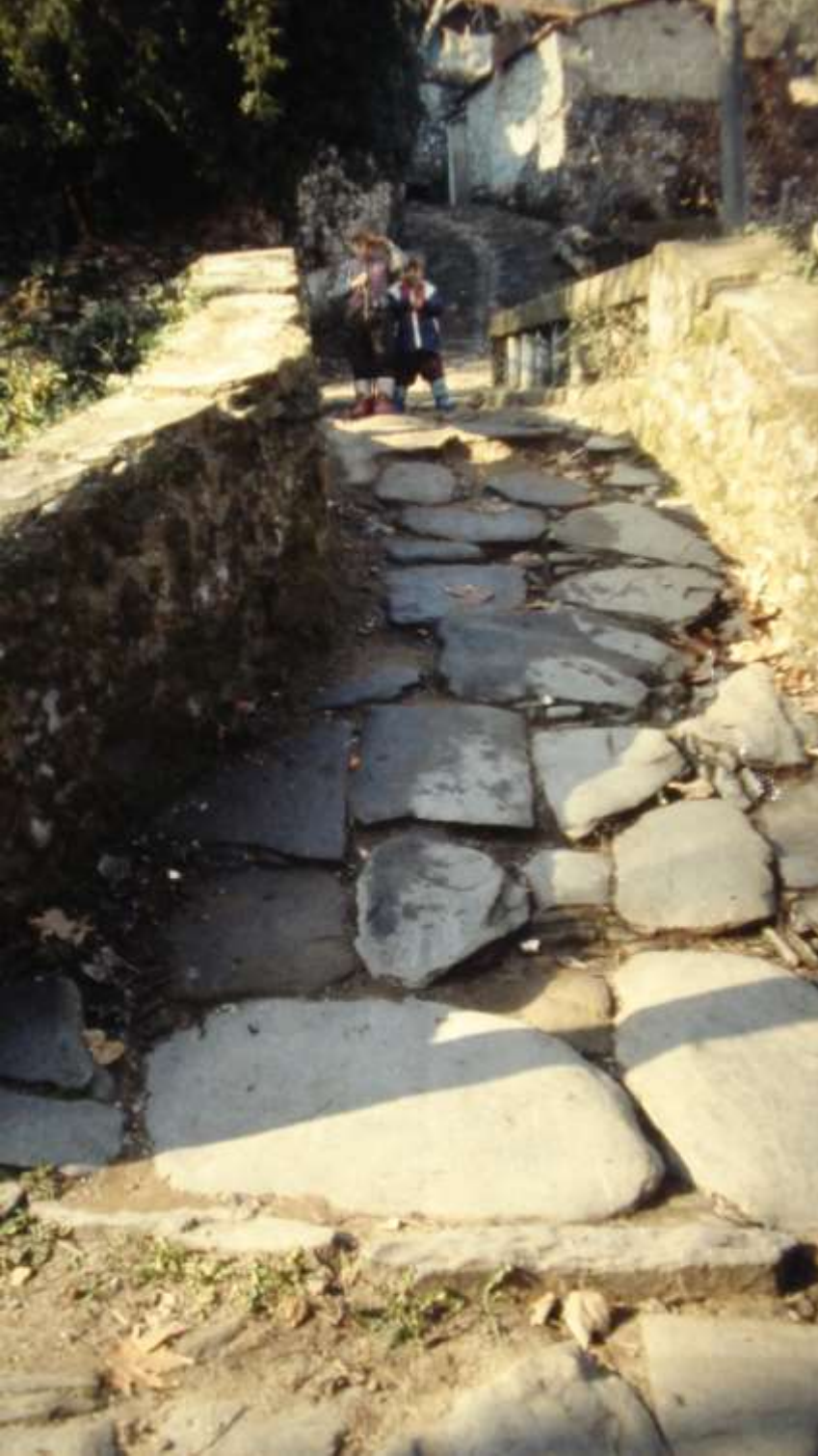
Tire. Dere kahve Mahallesi. Dere kahve Deresinin üzerindeki köprü. Köprünün iki yanı korkuluk duvarı ile desteklenmiş, yürüyenlerin güvenliği sağlanmış ve yürüme yolu iri taşlarla kaplanmıştır.