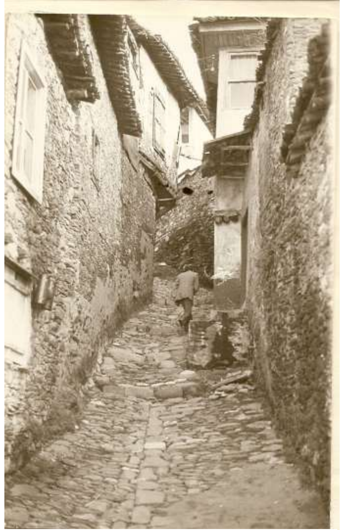
Sokağın dili. Tire Şeyh Cami yokuşunda evlerin iç içe olduğu bir çıkış. Tire'de eski mahallelerdeki sokaklar çoğunlukta taş kaplama ve kimi yerde basamak şeklinde yükselmektedir. Sokağın taş kaplama eğimi, yağmur sularının yolun göbeğinde toplanıp akmasını sağlayacak biçimde yapılmıştır.

Aydın Eyaleti, Saruhan, Sığla, Menteşe, Denizli ve Aydın olmak üzere beş livadan oluşmaktaydı. Aydın livasına bağlı 29 kaza bulunmakta ve bunlardan en önemlisi ise Tire kazası idi. Aydın Sancağından gönderilen buyruğuların birçok örneğini Tire, Şer'iyye Sicillerinde görülmektedir. Bu nedenle, 1837 yılına gelinceye kadar, Tire tüm emirleri Aydın Sancağından almaktaydı. 1843 yılından sonra ise Tire emirleri İzmir Sancağından almaya başlamıştır. Buda bize İzmir'in sancak merkezi olduğunu dolayısı ile Tire'nin de buraya bağlandığını kanıtlamaktadır 1 .