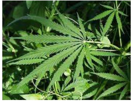
Kenevir (Kendir) bitkisi.

Kendir üretiminin yöredeki tarihi oldukça eski çağlara dayanmaktadır. Bu nedenle Tire ve çevresinde de bu ürünün yetiştirilmesi ve endüstriyel ürün olarak kullanılması, insanlığın bu ürünü dokumacılıkta kullanması ile başlamıştır dersek yanılmayız. İliman iklim bölgelerinde yetiştirilen kendirin ana vatanı Orta Asya'dır. Bu bitki, çalimsı, ortası boş olan bir yapıda ve boyları yaklaşık 3 metreye ulaşan bir bitkidir. Gövdesinde bulunan lifleri urgan, halat, çuval ve balık ağı yapımında kullanılmaktaydı. Yaprakları, tıp ve kozmetik alanında tohumları ise, besleyici ve yakıt olarak kullanılmıştır. Ayrıca tohumları sabun ve boya yapımı içinde kullanılmıştır. Kenevirin dişi eşeyli olanları esrar yapımında, eril olanları ise yağ ve liflerinden faydalanmak için üretilmiştir. Bu nedenle insanoğlunun esrar ile tanışıklığı da oldukça eski tarihlere dayanmaktadır. Esrar otu olarak ta bilinen bu bitki üzeri dikenimsi tüylü ve pürüklü bir gövde yapısına sahip olup, gövdenin içi boştur. Bu gövdeden çıkarılan lifler ise tarih boyunca dokumacılık için kullanılmıştır. Son yıllarda Anadolu'da yapılan kazılarda ele geçirilen dokuma tezgâhı ağırlıkları, dokumacılığın Anadolu'da çok eski tarihlere dayanmaktadır. Doğu Anadolu'da Çatal Höyük'te yapılan kazılarda yanmış mezarlarda karbonlaşmış bez parçalarının bulunması ve bu parçaların incelemesinde, bunların yün cinsi dokumalara ait olduğu saptanmıştır 2 . Kenevir, insanlık tarihinin en eski bitkisel ham madde kaynağı olmuştur 3 .