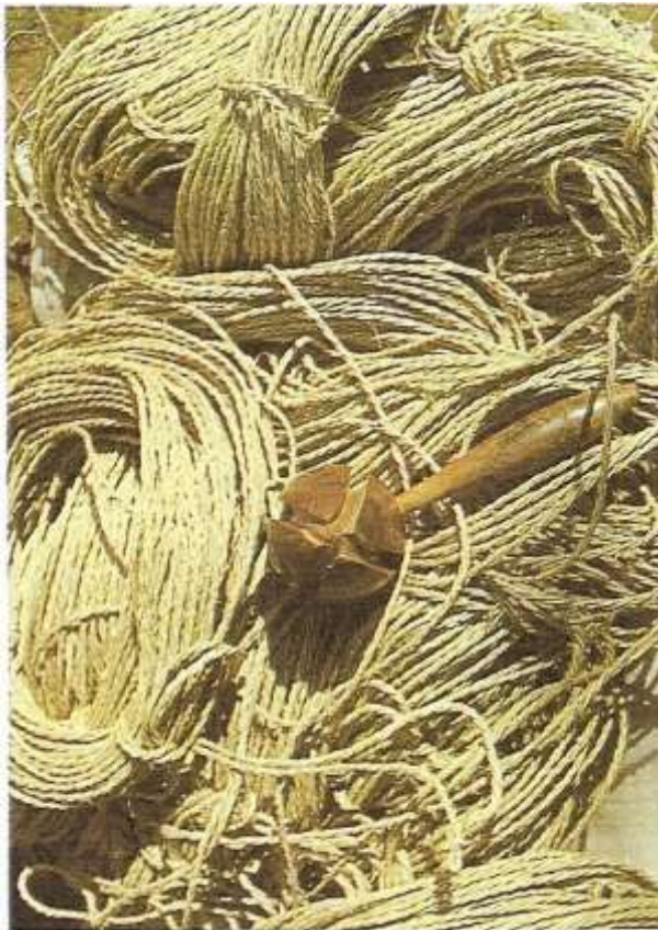
Urgan demetleri ve iLE’yi urgan haline getiren toplu.

ekonomisinin ana ağırlığını urgancı esnafı oluşturmaktaydı. Urgan pazarı, uzun yıllar esnafın gözü kulağı olmuş ve sürekli olarak pazarın bereketli olması için urgancı teşkilatı tarafından denetlenmiştir. Urgancı esnafının yüzünün gülmesi, pazarında canlanacağına inanılmıştır. Oldukça sıkı denetlenen urgancı esnafı pazara sürdüğü urganlarının kaliteli ve temiz olmasına dikkat etmek zorundadır. Teşkilat tarafından kontrol edilen urgan demetleri eğer hileli ve bozuk görülürse, başları boyanmakta veya kuzeye çevrilmekteydi. Demetlerin başının kuzeye döndürülmesi cezaların en ağır olanı olarak kabul edilmişti.