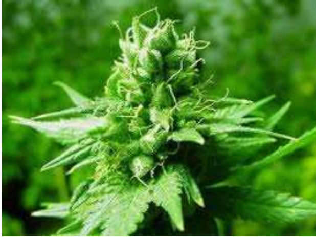
Kenevir bitkisi. Tohuma dönüştüğü an.