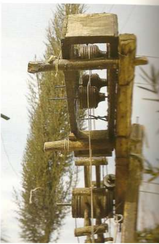
Köçe. Tezgahın solunda bulunmaktadır. Köçenin içindeki iğler mahlucın dönüşünü ve ile haline gelmesini sağlamaktadır.

konusunda önemli bilgilere ulaşılmaktadır 5-6 . Devletin içinde bulunduğu sıkıntılar nedeni ile, bedelin ödenmesi konusundaki buyruclara Tersane-i Amire defterlerinin kontrolünde, Darphane-i Amire defterdarı esseyid Ali Rıza Efendi bu muafiyetin yerine getirilmediğini görmüş ve bedelin ödenmesi için Aydın Sancağı ve Tire kazasına hitaben sıkça buyruldu gönderilmiştir. Şer'ıye Sicili I.cildinin 270. sayfasındaki bir kayda göre, aynı yıl içinde Tire'den "Asakir" için üç yüz adet urgan alındığı kaydı bulunmaktadır. Bu belgelerden birinde II.Mahmut (1808-1839) tarafından Aydın Eyaleti Müşiri Yakıp Paşa ile Tire Naibi'ne hitaben yazılmış bir ferman söz edilmektedir. Bu fermanla vergi muafiyetinin kaldırıldığı ve 1829 ile 1835 yılları arasını kapsayan ve "Kendir Ham Bedeliyesi" adı altında toplanan verginin Hekimbaşı Mustafa Behçet Efendi'ye ödenmesi istenmekteydi. Bu buyrucluya rağmen kantarı 45 kuruş üzerinden toplam 50 kantar ham kendir bedelinin (2250 kuruş) ödenip ödenmediği hakkında