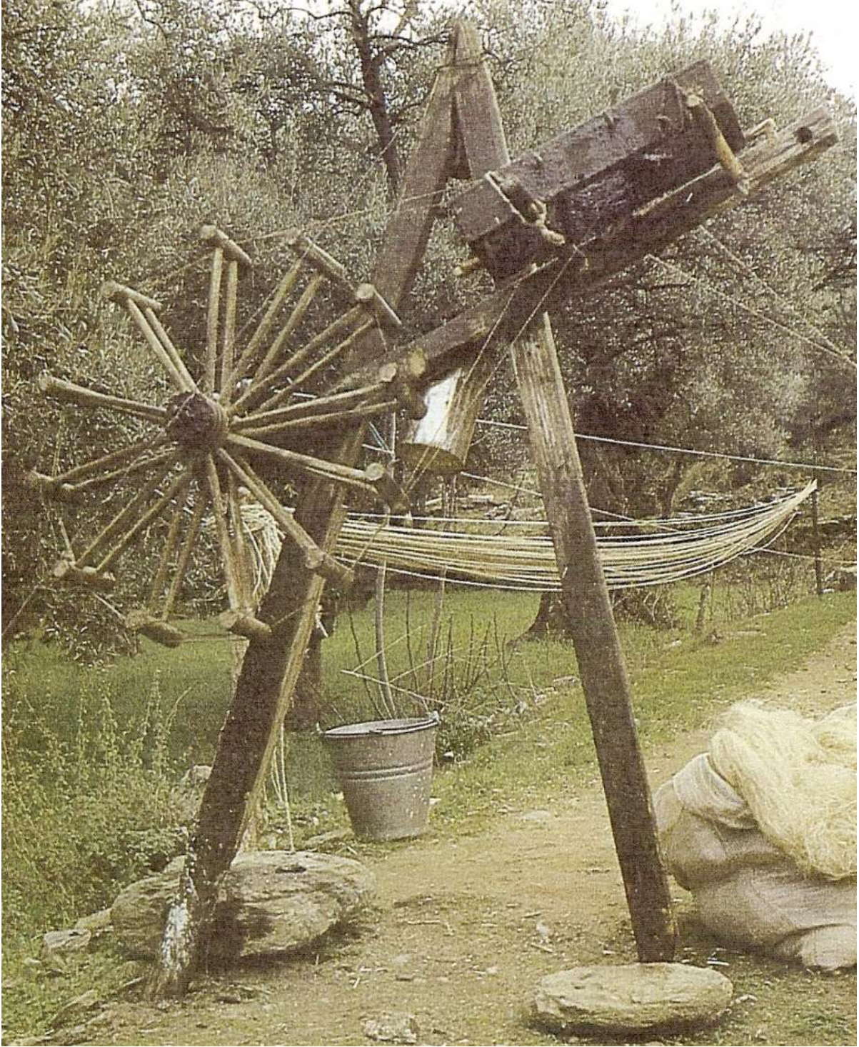
Urgan Tezgahı. Her şey ancak bu kadar işlevsel olarak planlanabilir.

Bu bilgiler ışığında şunu rahatlıkla söylemek mümkündür, Tarihin bu sonsuz akışı içinde, Tire’de her dönemde kendir bitkisi üretilmiş ve liflerinden urgan üretilmiş olduğunu söylemek yanlış olmasa gerekir. Özellikle saplarından çıkarılan beyaz lifleri dokuma sanayinde yaygın olarak kullanılmıştır. Tire Müzesi’ndeki bazı belgeleri incelediğimizde, Tire ve çevresinde kendir üretimi ve urgancılığı