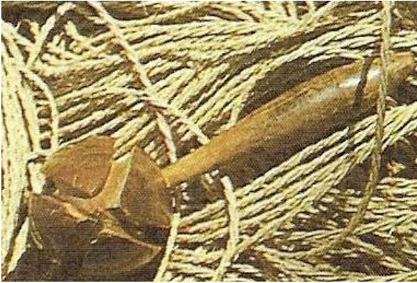
Toplu. Genellikle kestane ağacından yarım yumurta biçimli ve saplı olarak yapılmaktadır. Üç İLE’ yi toplamak için kullanılmaktadır.

Bu amaç için üretilen ve kullanılan alet ve diğer malzemeler oldukça basit, ancak amaca ulaştıracak ölçüde de önemli ve yeterlidir. Urgancı, urgan tezgahı hariç diğer malzemeleri “sırık, denge taşı, beldenlik, yolluk, boğazdanlık gibi” kendi olanakları ile temin etmektedir. Evinin bahçesindeki ağaçlar ve taşlar bunun için yeterlidir. Bu tip küçük tezgahlarda daha çok belirli çaptaki urganlar üretilmiştir. Urgan çeşitleri, Tire ve diğer yerlerdeki üretim terminolojisindeki adları ile, yarımlik, üçyüzlük, okkalık,