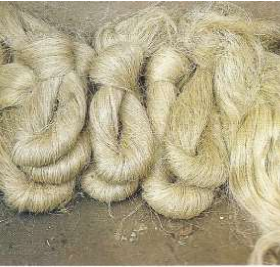
Kendirin mahliç olmuş hali.